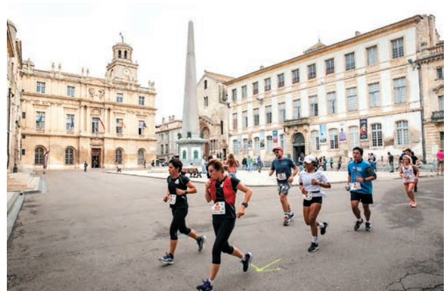
10 km d'Arles.