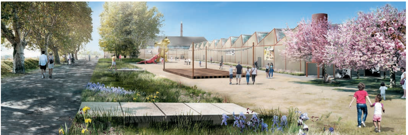
Quai de la Gabelle à l'horizon 2027. Illustration : ACCM

La requalification des Papeteries Étienne est en marche. La première tranche des travaux a démarré début 2024 avec la consolidation de la charpente puis la couverture des deux plus anciens bâtiments de la friche industrielle de Trinquetaille, propriété de la communauté d'agglomération ACCM. Une fois rénovés, ces 3800 m 2