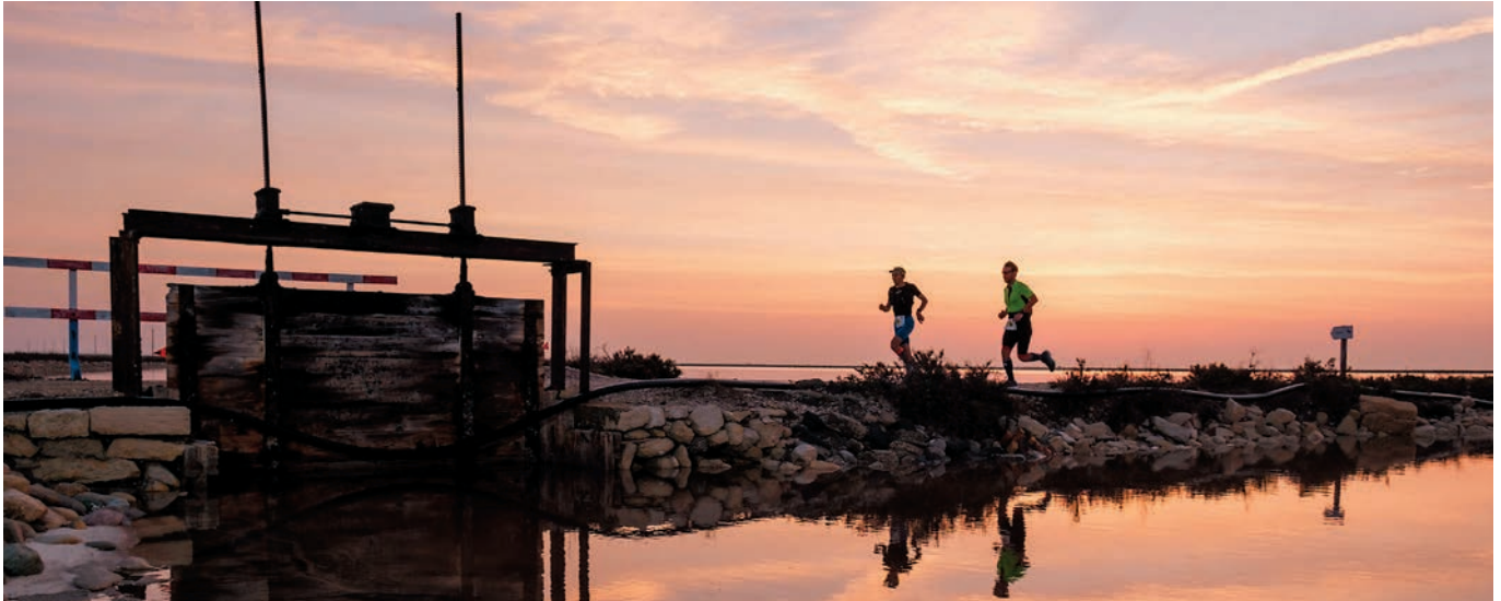
Grand Raid de Camargue.

Grand raid de Camargue, 10 km d'Arles, Corrida pédestre : trois courses à pied sont au calendrier en octobre. Vous hésitez ? Arles info vous aide à choisir.