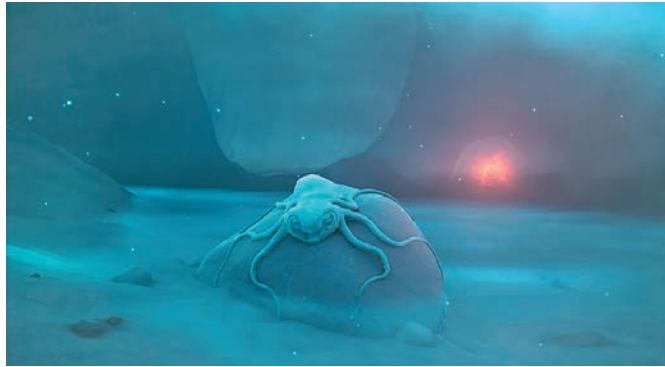
Illustration : Mary-Audrey Ramirez

Le festival qui ouvre les portes des mondes virtuels à tous, se place cette année sous le signe du respect de notre environnement. « Cela impose forcément des contraintes, des limites à ne pas franchir, des esthétiques