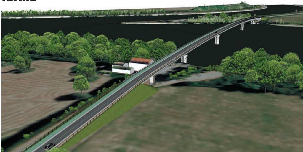
Illustration : Cabinet Artelia

Le pont sera construit à l'endroit même où passe le bac, reliant ainsi la D36 côté Salin-de-Giraud à la D35b côté Port-Saint-Louis. Il s'élèvera douze mètres