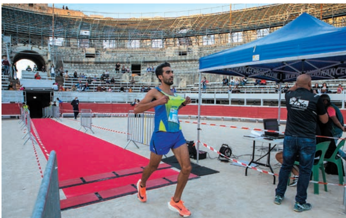
Corrida pédestre.