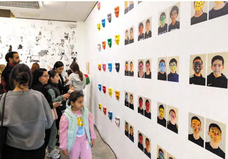
« Les enfants d'Arles exposent » révèle le travail des écoliers avec les artistes.