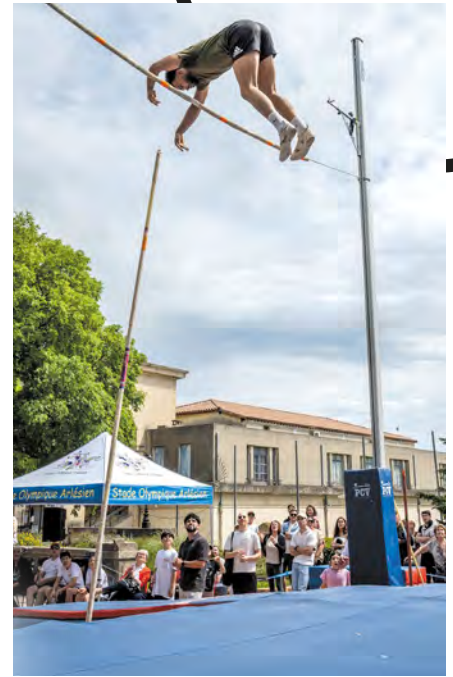
Les clubs arlésiens ont fait le show boulevard des Lices.