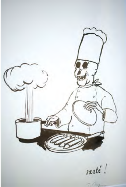
L'humour noir de Tomi Ungerer révéle au Museon Arlaten.