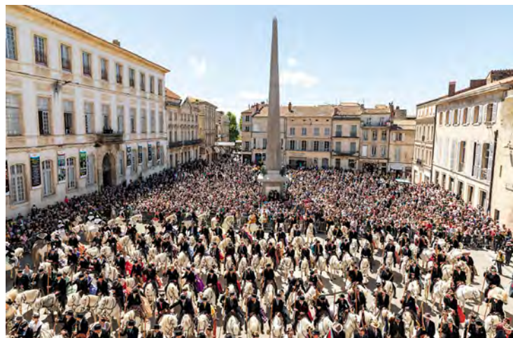
Après leur défilé, la bénédiction et la messe, Les cavaliers s'assemblent place de la République pour saluer la Reine.