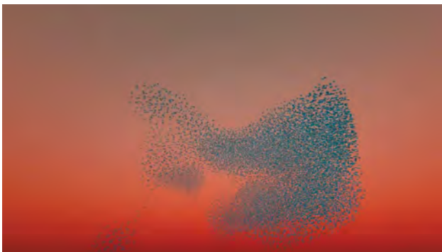
Coded Nature, 2022.

Le 5 avril 2014 la première pierre de la Tour conçue par Frank Gehry, projet de la Fondation LUMA Arles, était posée sur le site des anciens ateliers SNCF. Depuis, la Fondation est devenue un site majeur de l'art contemporain dans