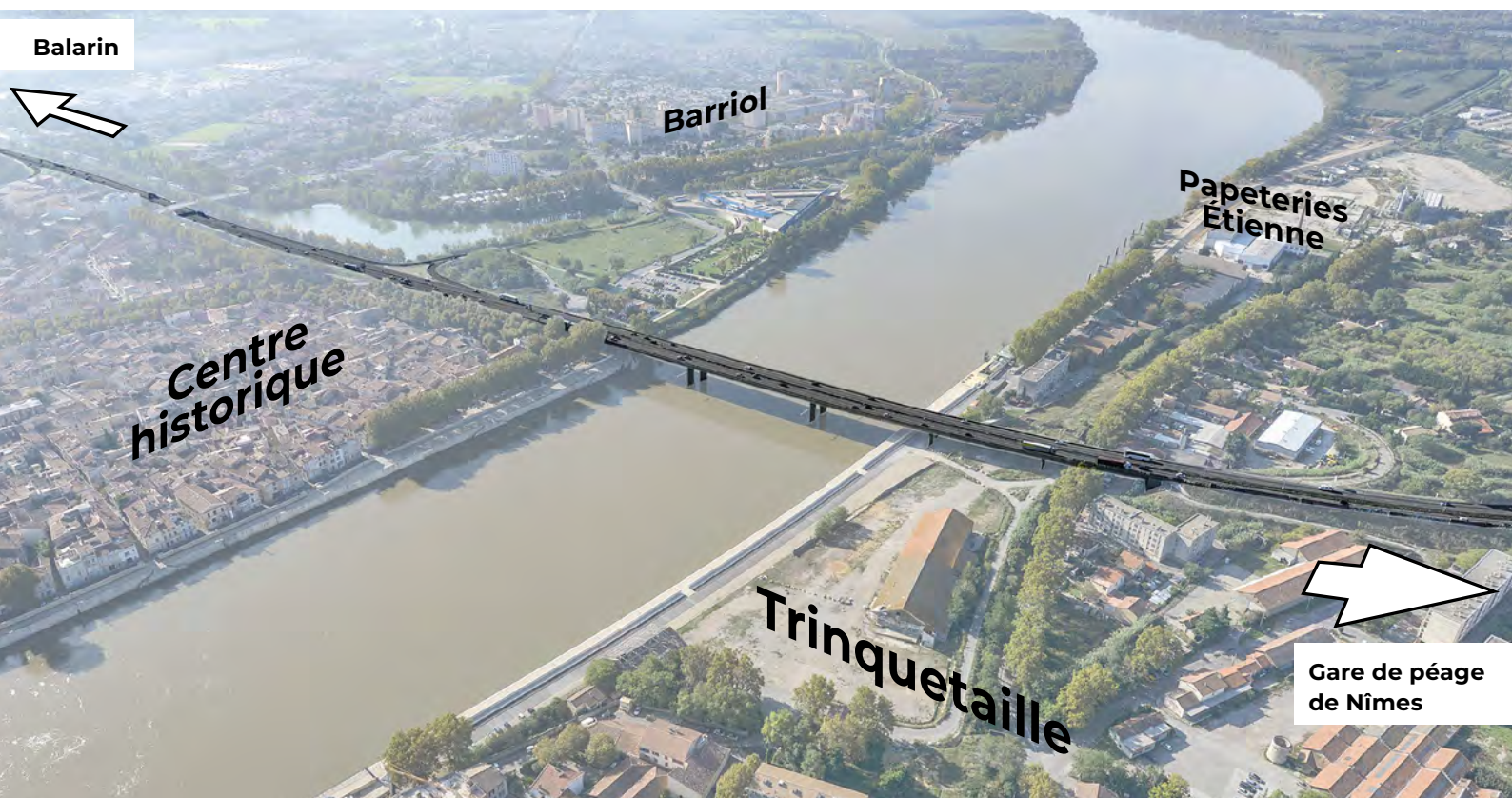
Imaginer la ville sans la coupure de la RN 113 : c'est l'enjeu de la réflexion actuelle.

Quand le contournement autoroutier aura été construit, le tronçon de la RN 113 qui traverse la ville jouera un rôle majeur dans la modernisation d'Arles. Son aménagement futur va être présenté aux Arlésiens avant l'été.