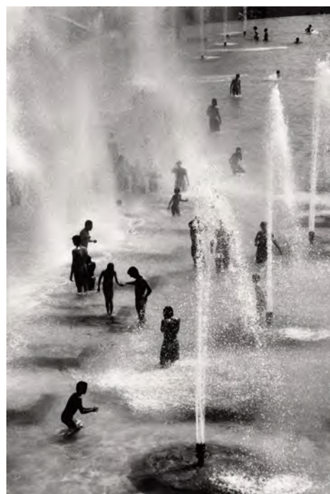
Paris, Parcs et jardins, Fontaines du Trocadéro, 1994.