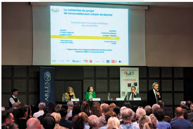
Le maire d'Arles et les élus ont présenté le projet aux habitants le 12 avril.

ACCM ANRU Bailleurs sociaux Caisse des dépôts et consignation Département des Bouches-du-Rhône État (fonds vert) Région Provence-Alpes-Côte d'Azur Ville d'Arles