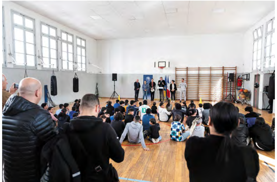
Gymnase Amédée-Pichot.

Comme neufs, ou presque. Les élus ont visité le 17 avril les gymnases Robert-Mauget et Amédée-Pichot, entièrement refaits. Les accès au gymnase Robert-Mauget, situé au cœur du quartier de Griffeuille, ont été repensés, un parking et des vestiaires ont été créés, tout a été repeint et la salle de boxe, le dojo et l'espace de sports collectifs ont été rendus indépendants. « On a pu déplacer le ring et réagencer la salle de façon plus efficace » se réjouit Yassine, éducateur pour l'activité boxe. « Le tatami, qui avait 20 ans, a été remplacé