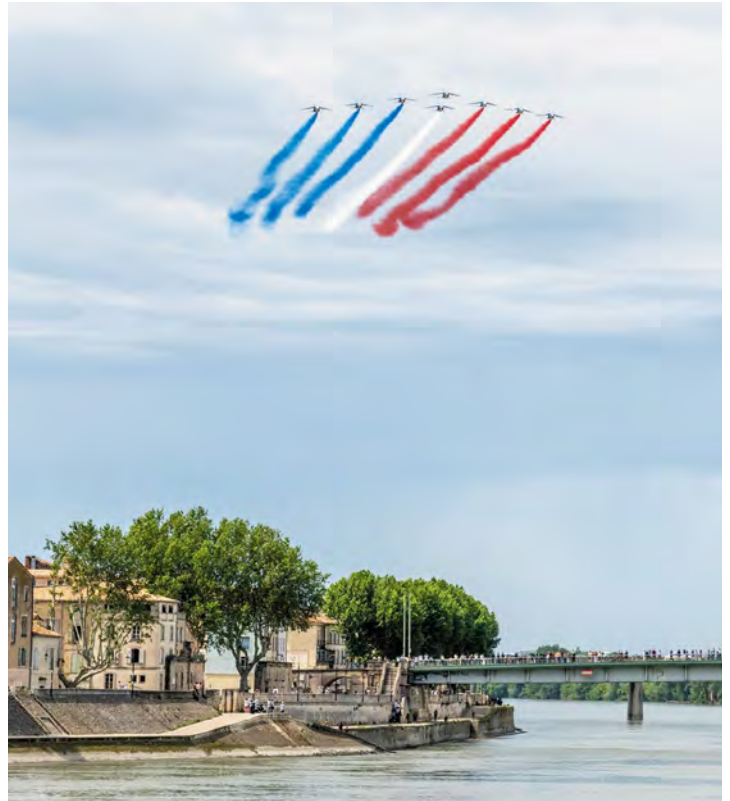
La Patrouille de France a survolé la ville, peu après midi.