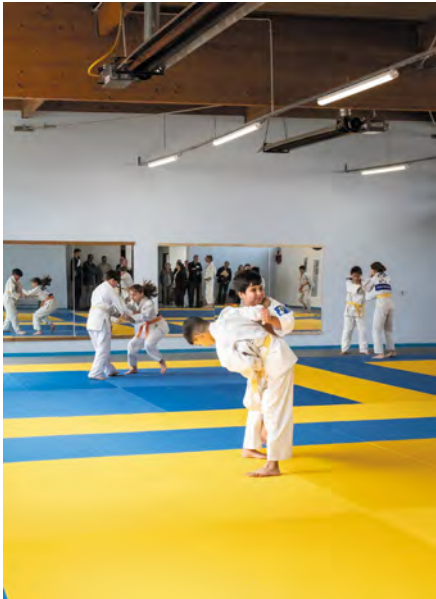
Gymnase Robert-Mauget.