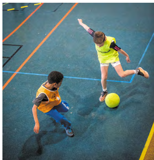
Dans les CAS, on pratique les sports et l'esprit d'équipe.

Découverte des sports collectifs, football, rugby, basket, handball, volley et sorties à la piscine.