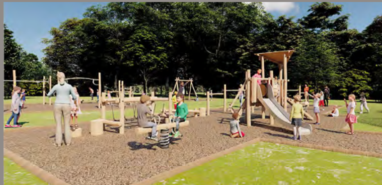
Illustration : Proludic

Toute proche de la réserve naturelle des marais de Beauchamp, dans le quartier de Pont-de-Crau, l'aire de jeux en cours de construction entre les deux terrains de football, présente la particularité d'être en bois. Pour l'instant, il s'agit de