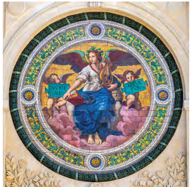
La mosaïque qui orne la fontaine Amédée-Pichot a été nettoyée.

46 % conseil départemental des Bouches-du-Rhône, 28 % ville d'Arles, 14 % État au titre de la Dotation de soutien à l'investissement local, 6 % Préfet de la région Provence-Alpes-Côte d'Azur, 6 % Région Sud Provence-Alpes-Côte d'Azur.