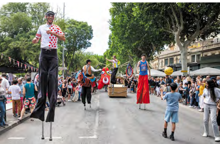
L'Olympic parade a semé sa bonne humeur dans les rues d'Arles.