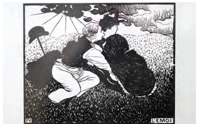
Félix Vallotton livre une extraordinaire chronique des mœurs de ses contemporains.