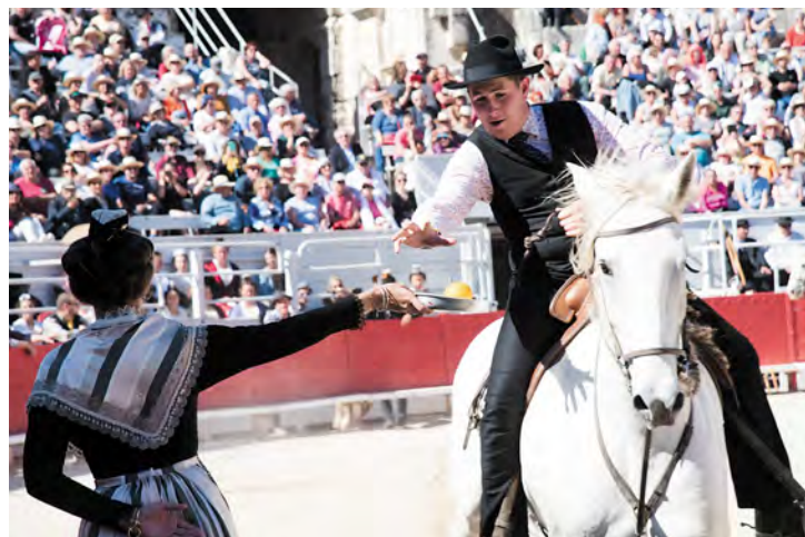
Aux arènes, les cavaliers et leurs chevaux de race Camargue enchaînent les démonstrations.