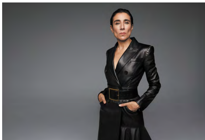
Très engagée dans l'usage des nouvelles technologies, la chorégraphe Blanca Li est présidente de l'association Arles créative. Photo :