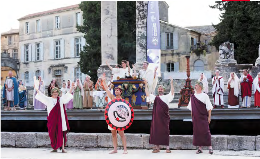
Une reconstitution historique avec 100 figurants a précédé l'arrivée de la Flamme au théâtre antique.