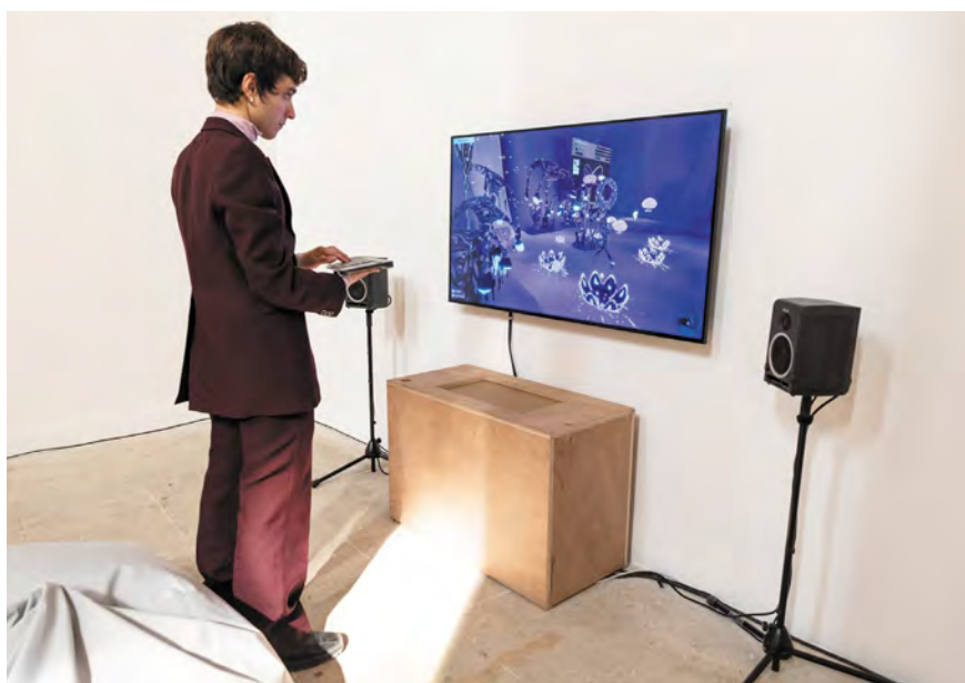
Tous les ans, le festival Octobre numérique illustre la façon dont les artistes renouvellent le processus créatif en s'emparant des outils numériques.

L'association Arles Créative et le campus connecté y prendront leurs quartiers en septembre, suivis quelques semaines plus tard du salon de la création digitale dans le cadre d'Octobre numérique. « Notre ambition est de miser sur les industries culturelles et créatives, qui constituent déjà l'ADN de notre territoire : en France, elles représentent 640 000 emplois et 90 milliards d'euros de chiffre d'affaires » a déclaré Patrick de Carolis, maire d'Arles et président de la communauté d'agglomération Arles-Crau-Camargue-Montagnette, deux collectivités à l'origine de l'association Arles Créative en 2022. Outil fédérateur des acteurs de la filière, elle porte en parallèle le développement d'un pôle territorial Industries culturelles et créatives, lui aussi labellisé France 2030. Arles Créative est présidée par la chorégraphe Blanca Li, une personnalité emblématique pour son rôle pionnier dans l'innovation artistique, et qui vient d'être nommée à la tête de la Grande Halle de la Villette.