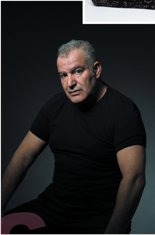
Magyd Cherfi.