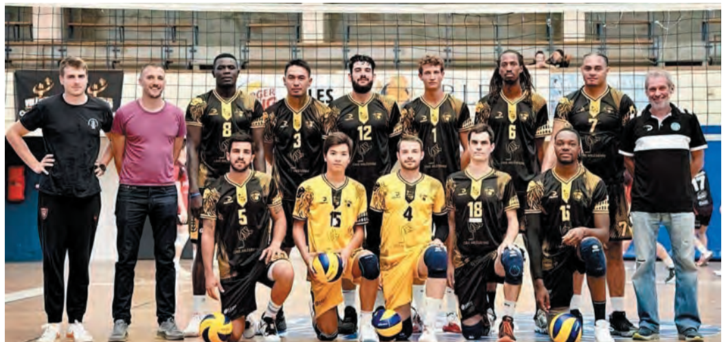
Le VBA est aux portes du Final 4 de la coupe de France.

Si dans son championnat de Nationale 2, le Volley-Ball Arlésien (VBA) peut jouer les gros bras (8 victoires en 8 matchs), il est en revanche le petit poucet de la coupe de France, où tous les clubs encore en lice évoluent à l'étage supérieur. Le VBA est donc condamné à l'exploit le 4 février dans son antre de Fournier pour valider son ticket et accéder au fameux Final 4 qui réunira le dernier carré de