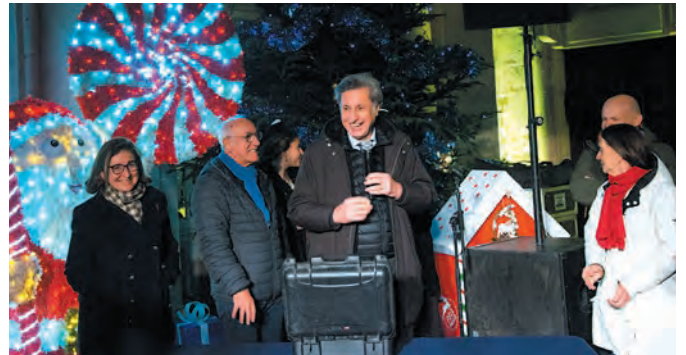
Patrick de Carolis, le maire d'Arles, entouré de plusieurs élus, a lancé les illuminations le 3 décembre dans la salle des Pas-perdus de l'hôtel de ville.

D es rires aux éclats qui s'échappent d'un petit chapiteau posé devant l'Espace Van-Gogh, des notes de musique qui s'envolent sur les places, des pichoun qui grimpent sous l'obélisque et se baladent à dos de poneys, des santons par centaines dans les églises, des belles histoires et des jeux à partager en famille à la médiathèque, des animations gourmandes dans les quartiers et les villages... Tout au long du mois de décembre, la Ville et les commerçants se sont associés pour jalonner la commune, quartiers et villages compris, de petits bonheurs festifs. Autant de cadeaux de Noël offerts par Les Calend'Arles.