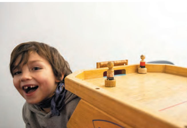
L'espace Noël des Pichoun, c'est un petit paradis pour les enfants de tous les âges, autour de jeux de société, avec la complicité notamment de l'association Martingale.

La fontaine aux jouets organisée le 10 décembre par France Bleu Provence et la Ville, place de la République, a permis de gâter un peu plus les enfants des bénéficiaires du Secours Populaire d'Arles. Les jouets ainsi réunis ont été offerts lors du Sapin de Noël de l'association, le 17 décembre à la salle des Fêtes.