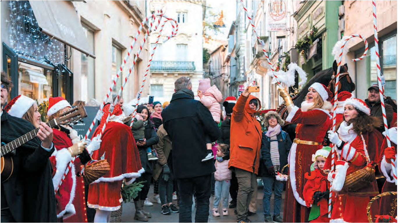
Les courses de Noël ont pris une couleur joyeuse grâce aux animations proposées par le Groupement des associations de commerçants du centre-ville.

D es rires aux éclats qui s'échappent d'un petit chapiteau posé devant l'Espace Van-Gogh, des notes de musique qui s'envolent sur les places, des pichoun qui grimpent sous l'obélisque et se baladent à dos de poneys, des santons par centaines dans les églises, des belles histoires et des jeux à partager en famille à la médiathèque, des animations gourmandes dans les quartiers et les villages... Tout au long du mois de décembre, la Ville et les commerçants se sont associés pour jalonner la commune, quartiers et villages compris, de petits bonheurs festifs. Autant de cadeaux de Noël offerts par Les Calend'Arles.