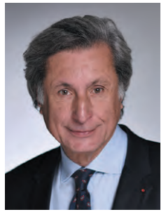
PATRICK DE CAROLIS