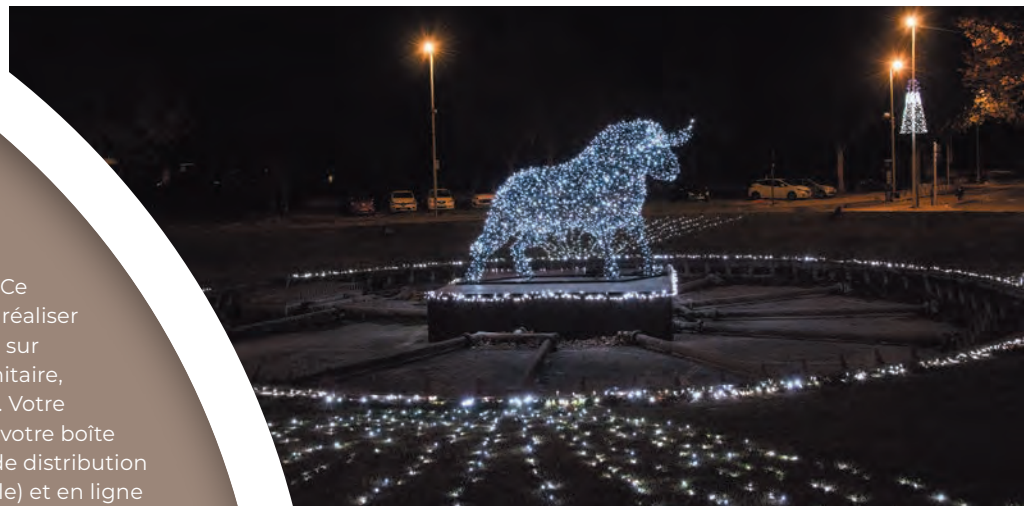
Le taureau lumineux qui veille sur le rond-point Lamartine : un motif spécialement créé pour la ville d'Arles.

À compter du mois de janvier 2023, votre magazine Arles Info change légèrement de formule : il paraîtra désormais une fois tous les deux mois. Ce changement de périodicité permet de réaliser d'importantes économies, notamment sur le prix du papier qui, depuis la crise sanitaire, connaît des augmentations soutenues. Votre magazine sera toujours distribué dans votre boîte aux lettres, disponible dans les points de distribution (notamment à l'accueil de l'hôtel de ville) et en ligne sur kiosque.arles.fr . Et vous retrouverez toute l'actualité arlésienne sur les réseaux sociaux et sur ville-arles.fr