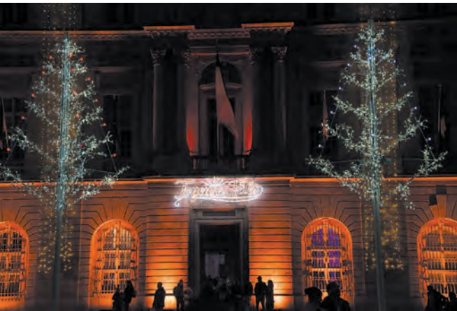
L'hôtel de ville en habit de lumières.