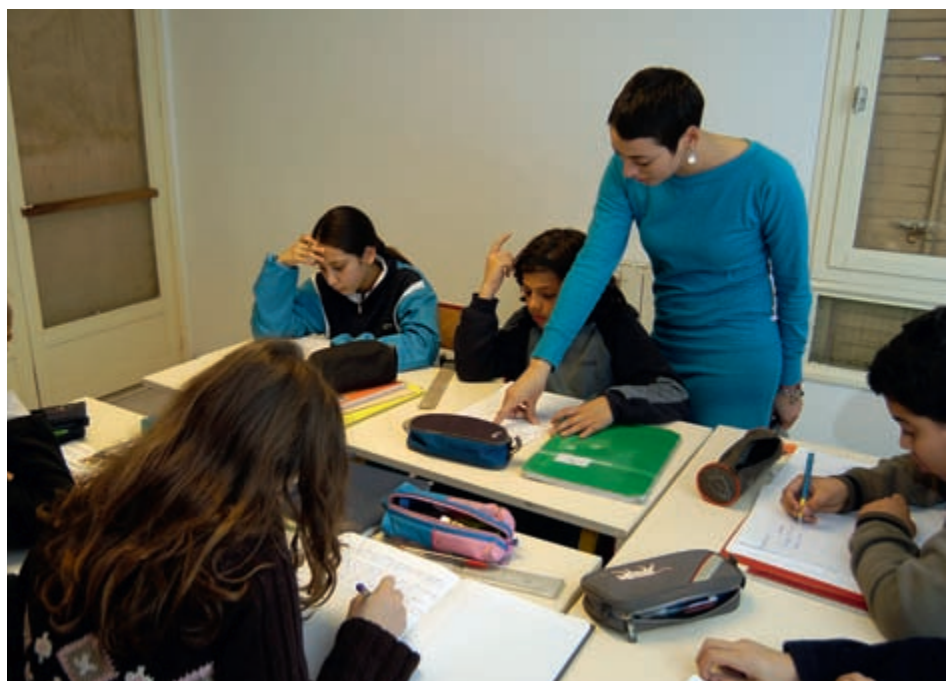
Depuis 15 ans, l'accompagnement scolaire par les ATP a fait ses preuves

Clé, comme Club Lecture Écriture, s'adresse aux petits de cours préparatoire en moyenne difficulté. Il est déployé dans les écoles Paul Langevin, Georges Brassens, Albert Camus, Amédée Pichot, Jules Vallès et de Mouleyres. Les enfants concernés se voient proposer, par groupe de cinq, un atelier le soir de 16 h 30 à 18 h, pour compléter l'apprentissage de la