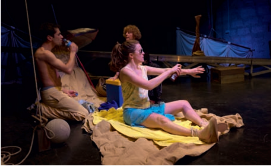
Reprise de Camus, l'Odyssée en décembre