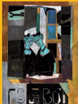
La Fenêtre