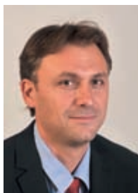
GROUPE Vive Arles