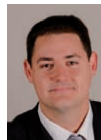
GROUPE Arles en capitale

Nous espérons vivement, dans l'intérêt d'Arles et des Arlésiens, qu'il n'est pas trop tard. Mais qu'on le veuille ou non, notre avenir dépend désormais d'une hypothétique décision de justice.