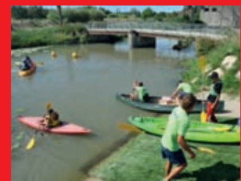
Loisirs animations Le service qui prend soin des enfants