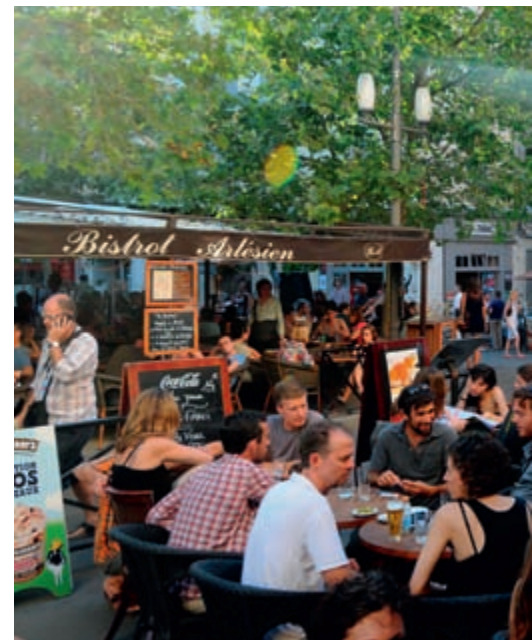
La surveillance de l'espace public du centre-ville, abondamment missions de la police municipale

« Nous avons recruté Stéphane Chassepot comme chef de la police municipale en 2011. Il s'occupe notamment du recrutement des agents de cette police. Les actuels agents de surveillance de la voie publique (ASVP) pourront être formés afin de devenir policiers municipaux », précise l'élu. L'effectif sera de cinq policiers municipaux en 2012.