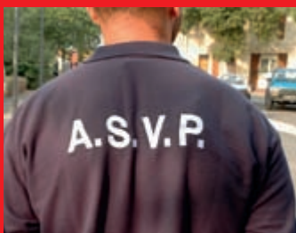
Sécurité La police municipale s'installe

Arles par temps de danse, 15 représentations du 9 au 16 mai