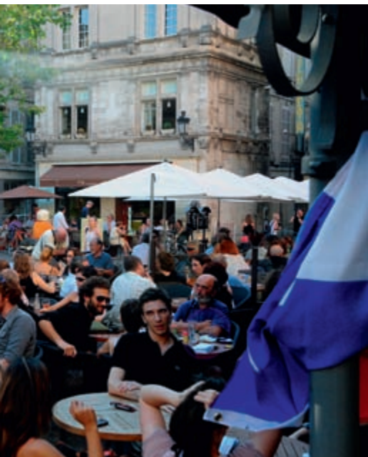
et fréquenté pendant la période estivale, fait partie des

Le réseau de fibre optique installé en 2012 permet d'équiper de caméras la halte routière, boulevard Clemenceau, et la place de la République. Ces caméras seront reliées à un central de la police municipale équipé d'écrans de contrôle et de disques durs enregistreurs informatiques, central lui-même consultable depuis le commissariat en cas de besoin.