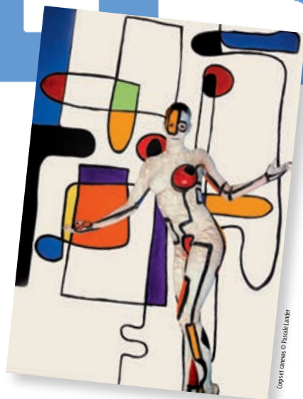
Copy et canevas © Pirella Göttsche

Programme intégral, stages, et performances sur le site www.fepn-arles.com