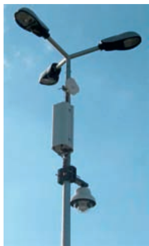
Les caméras Anymax seront installées dans un premier temps à la halte routière et place de la République.

Autre mesure de sécurisation de l'espace public, un système de vidéoprotection est mis en place cette année sur deux sites urbains. « Le ministère de l'Intérieur incite les communes à s'équiper de caméras video. Ces équipements sont un outil supplémentaire à la disposition des services de police », ajoute Martial Roche.