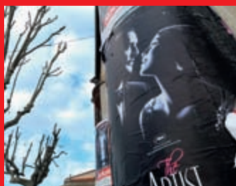
Cinemas Une offre plus variée et la 3D