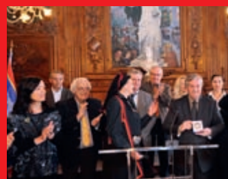
Jumelage Kalymnos, un air de la mer Égée