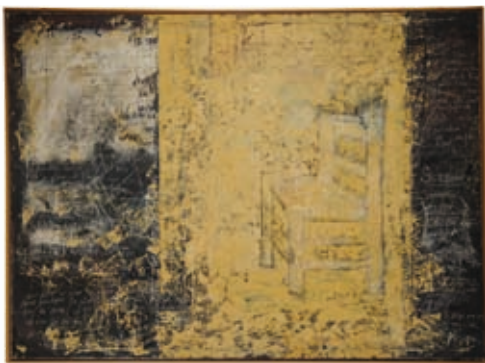
"Repentir pour l'ombre de Vincent" de Jean-Paul Pancraczi, œuvre de la collection de la fondation.