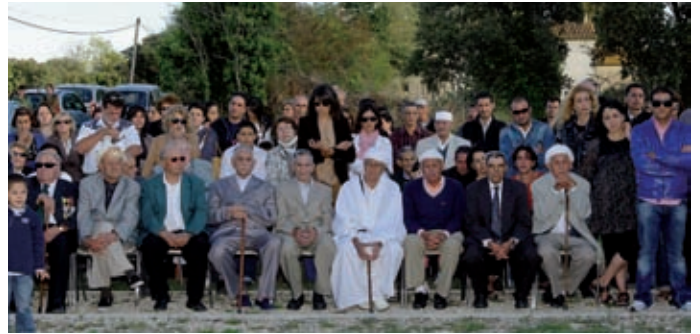
En présence de la communauté harkie

tentes. Progressivement les constructions deviendront la cité du Mazet, où vendredi 24 septembre 2010 la plaque en l'honneur du Bachaga a été posée et dévoilée par les autorités.