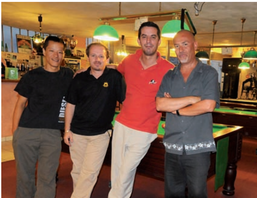
Pourquoi pas une école de billard à Arles ?