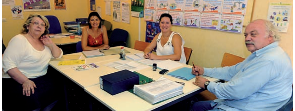
L'équipe de la CLCV dans ses locaux.

Consommation, logement, cadre de vie, la CLCV soutient et défend les consommateurs, locataires et habitants dans leurs soucis de vie quotidienne et de voisinage. L'association prodigue aussi des conseils avisés en matière d'économie d'énergie et d'installations dans son espace Info énergies.