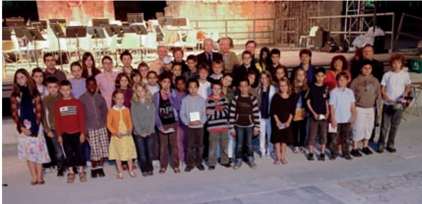
Remise des prix au Théâtre antique

Si vos enfants souhaitent apprendre à jouer d'un instrument, c'est dès les premiers jours de septembre qu'il faut les inscrire à l'école de musique intercommunale.