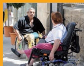
Sécurité p. 21 Semaine de la mobilité

retrouvez l'actualité sur www.arles-info.fr