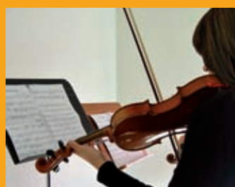
École de musique p. 19 Inscription en septembre