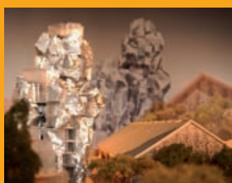
Fondation LUMA p. 2 La maquette de Frank Gehry