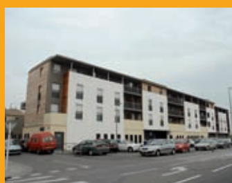
Habitat p. 12 La SEMPA recapitalisée