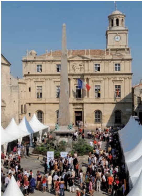
Photo de famille à l'appel des arènes

Centres équestres, cavaliers petits et grands, amateurs et professionnels offrent également au public un grand spectacle équestre le samedi 11 septembre à 21 h 30 aux arènes, sur le thème de la chanson française (entrée libre). Ce sont quelque 200 cavaliers et 120 chevaux qui ont monté pour l'occasion une douzaine de numéros !