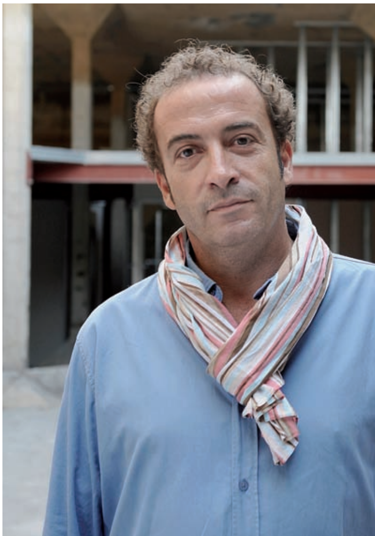
Texte : Alain Othnin-Girard