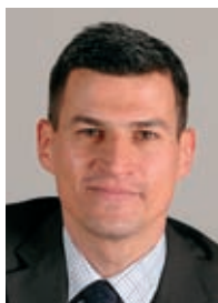
GROUPE Socialistes et Apparentés

Les élus du groupe « Vive Arles ! » vous souhaitent à toutes et à tous une bonne année 2010. Ensemble, continuons le changement !