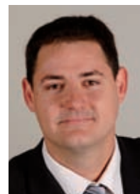
GROUPE Arles en Capitale