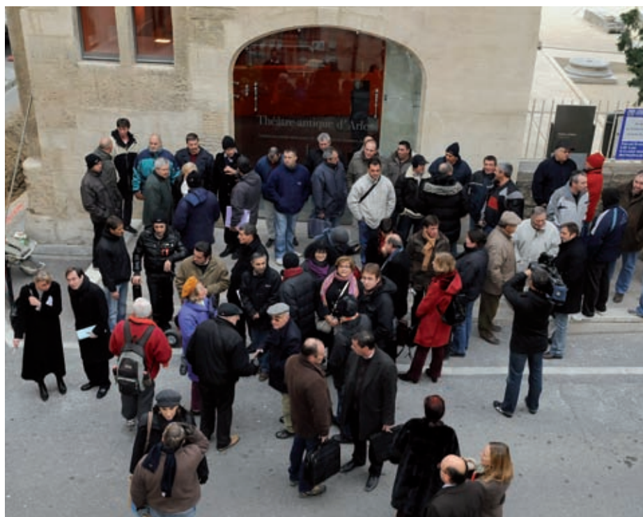
Rassemblement devant la sous-préfecture le 18 décembre en soutien aux salariés des Papeteries Étienne. Les syndicats présentent le projet de reprise d'activité.