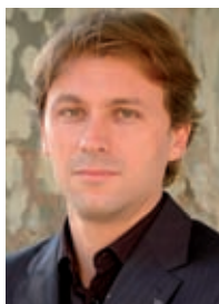
GROUPE Vive Arles