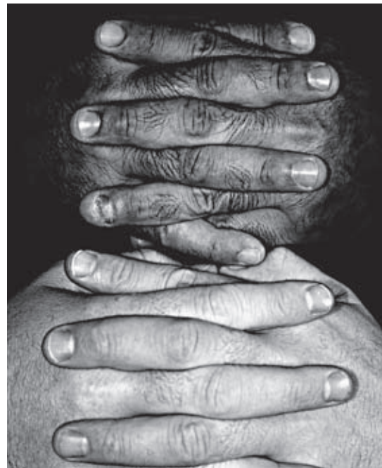
Stefano Cianci, Bianco e Nero 2009, coll. Musée Réattu

À partir de mars, la programmation de ce cocon d'écoute en tête-à-tête avec le fleuve sera consacrée à la collection Deutschlandradio Klang Kunst.