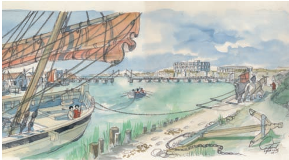
Aquarelles sur la une et ci-dessus: J.-M. Gassend - IRAA, CNRS

étudiants sont inscrits à Arles pour l'année universitaire 2009/2010, soit 170 de plus qu'en 2008.