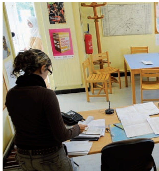
Rue Romain-Rolland, l'accueil de jour est ouvert toute l'année.