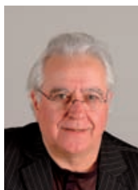
GROUPE Vive Arles