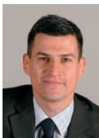
GROUPE Socialistes et Apparentés

La gestion contemporaine de l'eau, aujourd'hui présente toute l'année, de nos espaces camarguais est propice au maintien des moustiques. Il faut bien alors penser à se protéger, à une époque où l'on veut tout et tout de suite. Les risques sanitaires sont peu élevés, mais faut bien les prendre en compte. C'est pourquoi une démoustication pilote est menée depuis 3 ans dans le sud-est de la Camargue, à cheval sur Arles et Port-Saint-Louis, bientôt avec nous au sein du Parc, maître d'œuvre des études d'impact qui accompagnent cette opération, indispensables pour mesurer les impacts sur la faune non cible, par ailleurs indispensable dans la chaîne alimentaire à de nombreuses espèces d'oiseaux, gibier ou non. La démoustication est supportée financièrement par le Conseil Général, le Conseil Régional, les communes et les intercommunalités. Elle coûte cher : 1 million d'euros, qu'il faudrait multiplier au moins par un facteur quatre pour élargir l'opération à l'ensemble des espaces favorables au développement des nombreuses espèces de moustiques dont la majorité ne nous pique pas. La Camargue est un joyau avec ces paysages et cette nature magnifique connue dans le monde entier et qui nous apporte de très nombreux visiteurs (source de revenus), tout comme notre patrimoine historique, dont j'ose dire qu'elle fait aussi partie. Il faut la respecter.