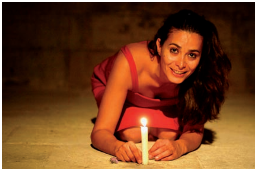
Le jour où Nina Simone... le 10 novembre au Méjan.