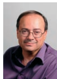
GROUPE Arles en Capitale