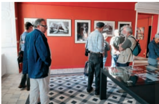
Vernissage Festival international de photo de nu

Les nouvelles plaques d'immatriculation en vigueur depuis le 15 avril pour les véhicules neufs concernent à partir du 15 juin les véhicules d'occasion. Les propriétaires peuvent y faire figurer le numéro du département de leur choix, mais il reste très discret. Pour ceux qui souhaitent revendiquer leur appartenance à notre département, on peut commander l'autocollant « 13, un amour de numéro » auprès du Conseil général info@cg13.fr