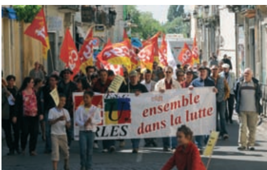
Défilé du 1 er -Mai dans la ville