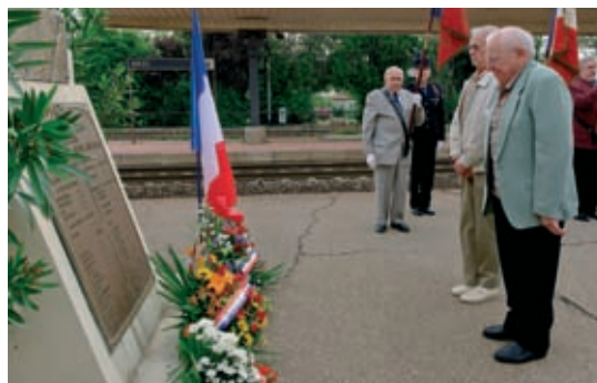
Cérémonies commémoratives du 64 e anniversaire de la victoire de 1945. Une plaque a été posée à la gare d'Arles en souvenir des agents SNCF victimes des deux guerres mondiales.