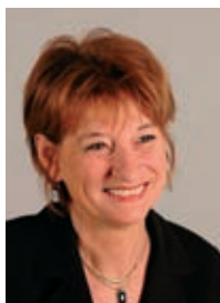
GROUPE Vive Arles