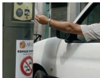
Circulation p. 6 Un plan pour l'été