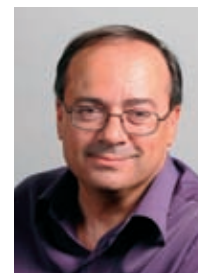
GROUPE Arles en Capitale

Le troisième est le site dit de la Zac des Minimes. Sous le précédent mandat, des négociations ont été conduites avec un aménageur. Soit. Cependant, l'aménagement de cet espace ne peut se faire sans une réflexion plus large, notamment sur les problématiques liées aux déplacements. Là aussi, cet aménagement ne peut être conduit en catimini et doit faire l'objet de véritables études urbaines, en concertation avec les habitants. Ces trois espaces sont majeurs pour maintenir une forte dynamique de l'habitat, pour favoriser l'accueil et l'installation de nouvelles entreprises, pour mieux organiser les conditions de déplacements et de stationnements et proposer à nos concitoyens de nouveaux équipements publics. Ces enjeux, certes moins médiatiques, me paraissent tout aussi fondamentaux pour le développement urbain de notre cité que la reconquête des Ateliers.