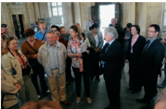
Délégation tchèque reçue dans le cadre de Qualicities

On vote le dimanche 7 juin. Les élections européennes se déroulent du 4 au 7 juin dans les 27 États membres de l'Union Européenne. Il s'agit d'élire nos représentants pour 5 ans au Parlement européen, soit 736 députés. La France vote le 7 juin pour élire 72 représentants. À Arles, les 33 bureaux de vote seront ouverts de 8 h à 18 h. Renseignements au service des élections au 04 90 49 36 53.