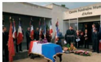
Obsèques de Colette Laffineur