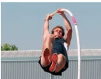
Athlétisme p. 7 Meeting international les 6 et 7 juin