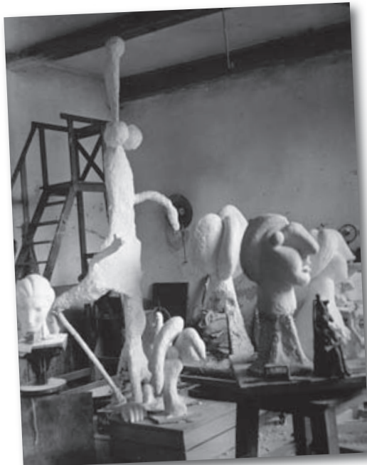
Brassaï, L'atelier de Boisgeloup, sculptures, 1932, D.R., Estate Brassai - RMN

Le Musée Réattu ouvrira ses portes le 8 juillet sur sa nouvelle exposition Musée Réattu, Chambres d'écho.