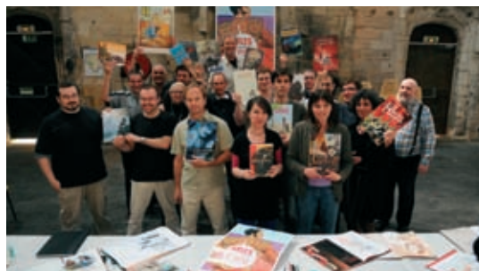
Arles fait ses bulles, festival de bande dessinée

L'inauguration des expos des Rencontres ne débutera qu'à partir de 15 heures, la Cocarde d'or est repoussée à 17 h 30, et l'abrivado du soir n'aura pas lieu.