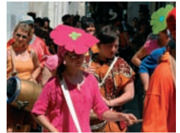
Fête de la musique p. 10 45 concerts le 21 juin