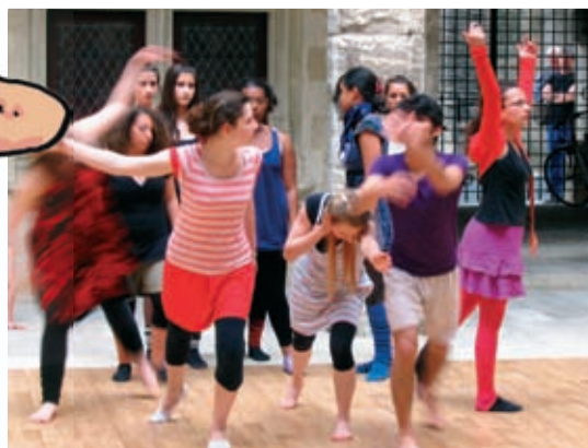
Arles par temps de danse