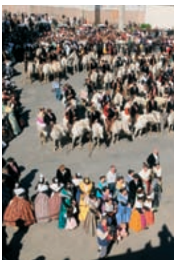
Fête des gardians, le 1 er mai

« Avec plus de 3000 adhérents et une moyenne de 150 passages quotidiens, les objectifs que s'était fixés Solid'Arles ont été atteints et même dépassés »