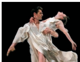
Tradition p. 14 L'année Mireille