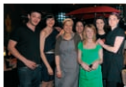
Soirée des filles au Cargo de Nuit

40 agents municipaux et 70 agents de police assureront la sécurité de l'étape du Tour de France qui traverse Arles le 6 juillet.