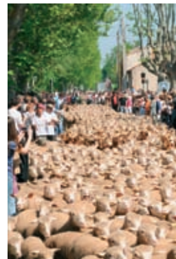
Fête du printemps à Moulès

On peut également profiter d'une visite du CFA chaque premier mercredi du mois. Horaire sur demande au 04 90 97 82 79.