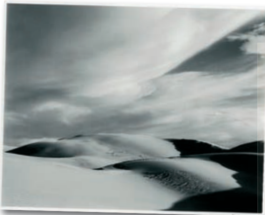
Edward Weston, Dunes, 1936, coll. musée Réattu, don de Jérôme Hill en 1970, D.R.

Musée Réattu, Chambres d'écho, du 8 juillet au 29 novembre 2009.