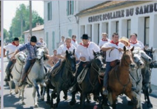
Abrivado au Sambuc au cours des fêtes votives fin juillet