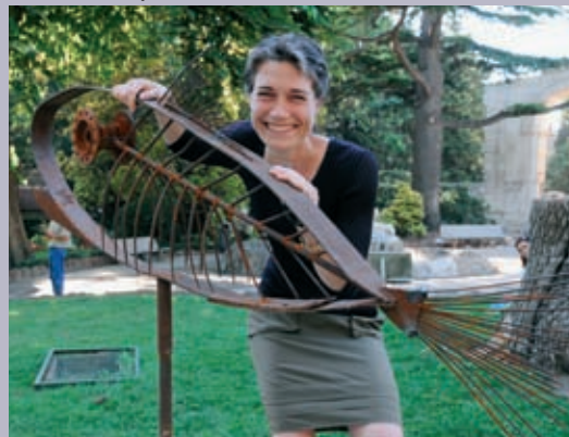
Les sculptures de Valérie Michaux dans le jardin d'été