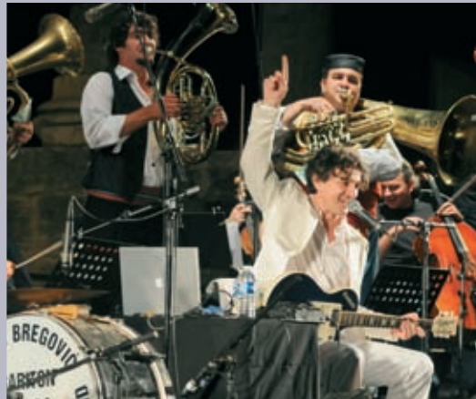
Goran Bregovic avec les Suds à Arles, le 17 juillet, au Théâtre antique