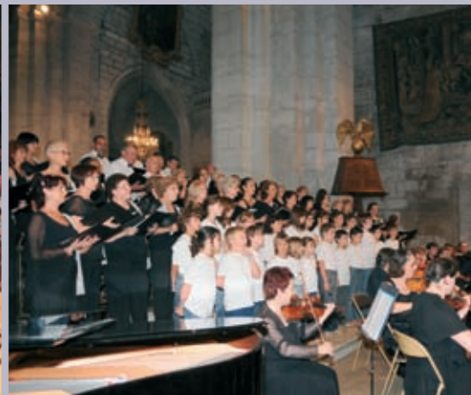
Concert "un chant pour la planète" à la basilique Saint-Trophime, le 29 juin, avec la chorale du Sambuc