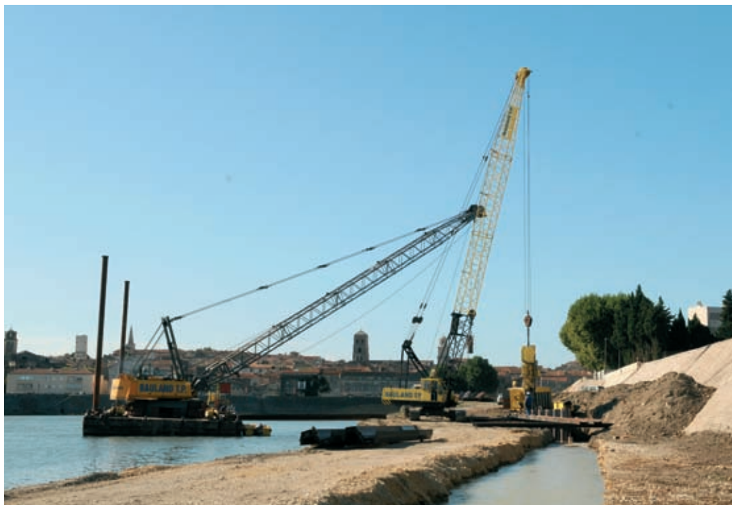
Sécurité et embellissements. Palplanches, béton et enrochements vont consolider et sécuriser les berges. Le pavement paysager, les parapets en pierre et les végétaux agrémenteront la promenade au bord de l'eau. Ici, côté cimetière de Trinquetaille

Démarrés en juillet 2008, les travaux de réfection des quais du Rhône vont changer le visage d'Arles en rapprochant la ville des berges de son fleuve, améliorant la sécurité des quartiers riverains