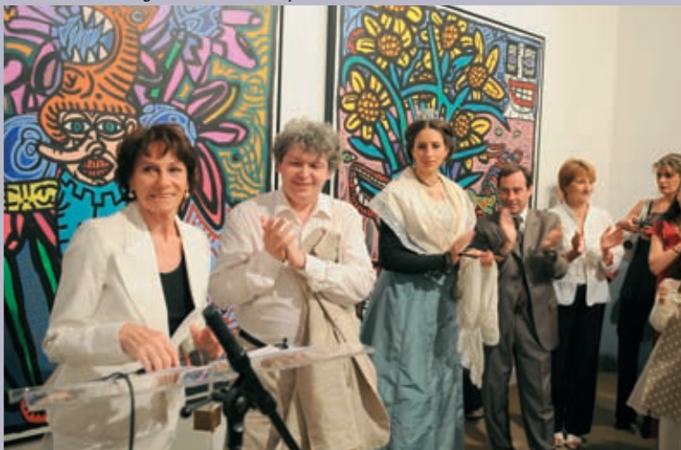
Inauguration de l'exposition "Qu'es Aco ?", de Robert Combas, à la Fondation Van-Gogh, début juillet