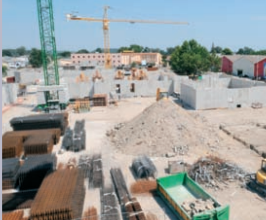
Chantier Erilia, chemin des Moines. 171 logements nouveaux