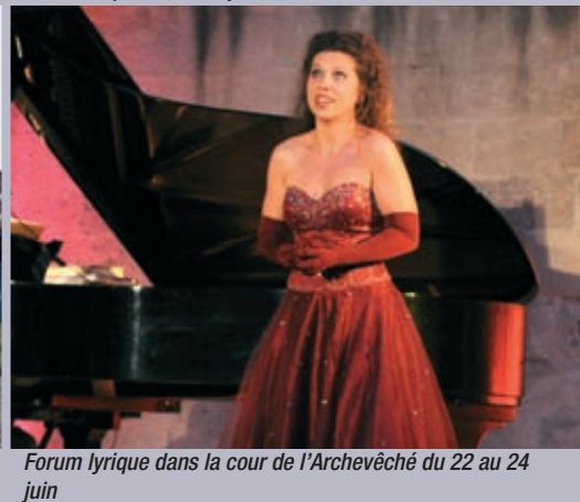
Forum lyrique dans la cour de l'Archevêché du 22 au 24 juin