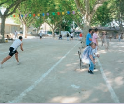
Grand prix bouliste à l'espace Daillan à Trinquetaille en juillet