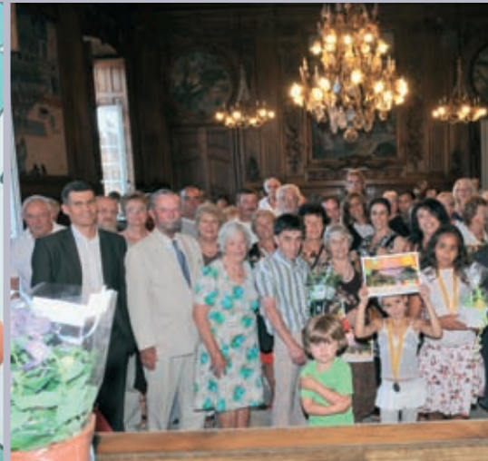
Cérémonie en mairie, pour le concours des Maisons fleuries en juillet