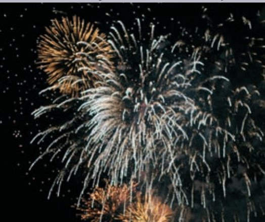
Le feu d'artifice du 14-Juillet tiré depuis Trinquetaille