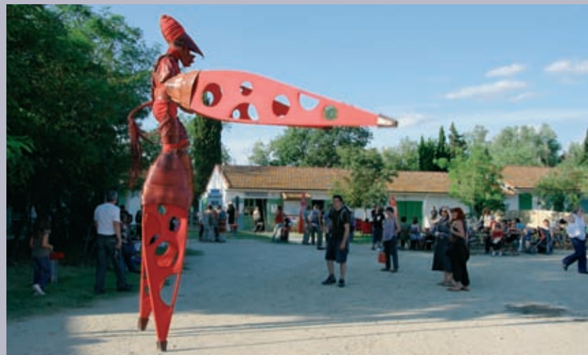
Festival les Envies Rhônements, à Mas-Thibert les 25 et 26 juillet