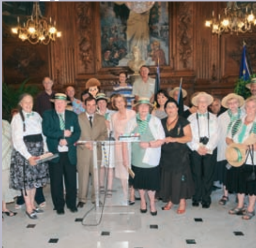
Le maire accueille les Belges de Verviers, jumelée avec Arles en juillet