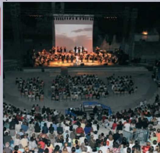
Le Condor remplit le Théâtre antique le 13 août