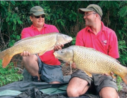
Belles prises lors de l'enduro du Rhône au lieu-dit La Triquette du 18 au 21 juillet