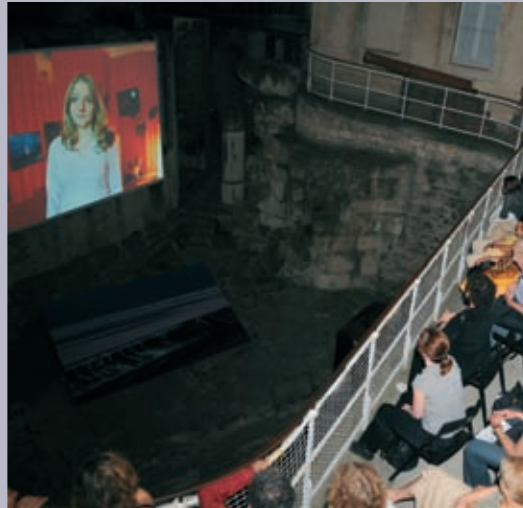
La Nuit de l'année dans la cour du Museon Arlaten le 11 juillet