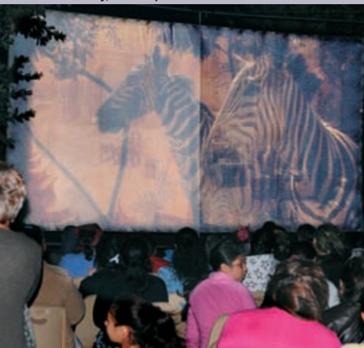
Un Été au ciné, en plein air au Trébon, place Gayet