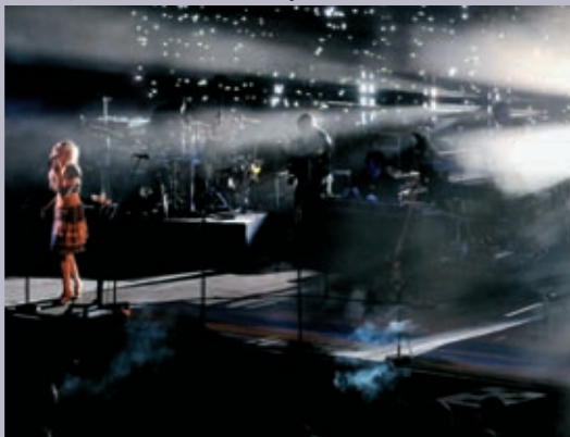
Massive Attack en concert au Théâtre antique. Les Escales du Cargo ont attiré 8500 spectateurs cet été