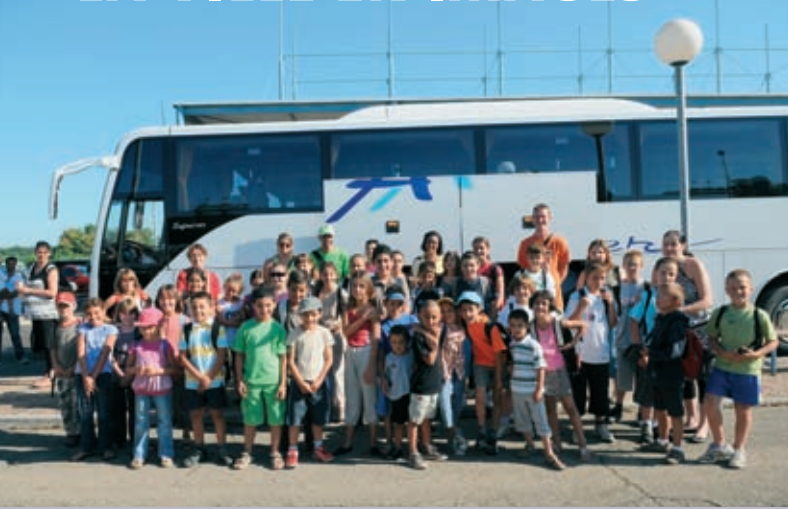
Départ en colonie en juillet