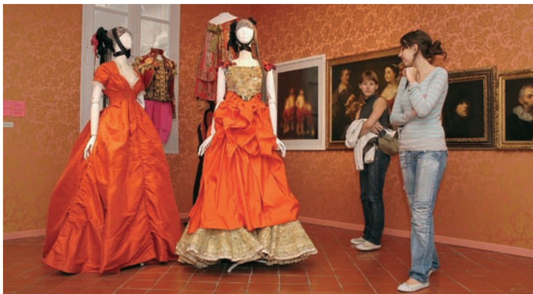
Les robes somptueuses du couturier côtoient les œuvres du musée et celles apportées pour l'occasion

Encore deux mois pour visiter l'exposition dont Christian Lacroix fait avant tout cadeau aux Arlésiens et au musée Réattu