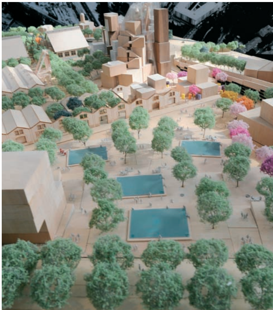
Une succession de terrasses arborées conduira progressivement vers l'esplanade et la fondation Luma

Dans la lumière dorée du soleil couchant, des centaines de personnes se promènent dans les allées. Des mamans avec poussettes reviennent de la halte-garderie. Des groupes d'ados se dirigent vers le cinéma multiplex. Des salariés