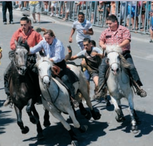
Abrivado à Salin-de-Giraud le 12 juillet