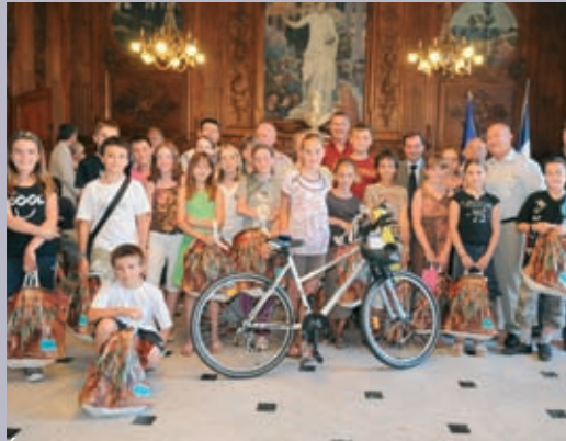
Récompenses aux enfants par la Prévention routière en juillet