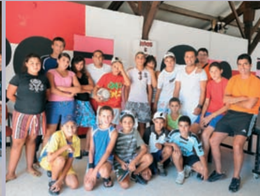
Les jeunes participant au centre d'animation sportive en août à Mas-Thibert