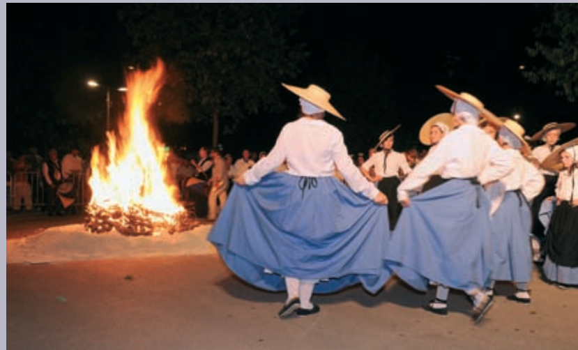
Feu de la Saint-Jean fin juin esplanade Charles-De-Gaulle