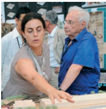
Ateliers SNCF, Maja Hoffmann et l'architecte Frank Gehry présentent le projet. P.4