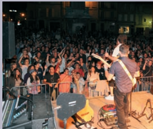
Concert du 14-juillet avec Roy Paci & Aretisla, place de la République