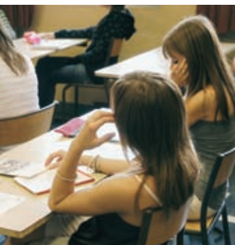
Rentrée scolaire, la semaine de quatre jours P.10