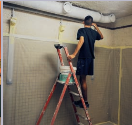
Travaux dans les équipements sportifs avant la rentrée