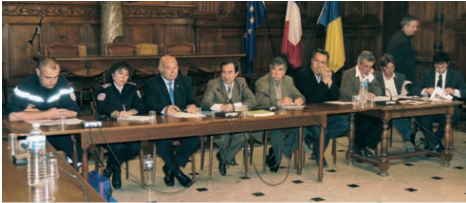
Les partenaires de la Feria réunis pour mettre en place le dispositif de sécurité

Les ferias d'Arles se sont fait une réputation par la qualité des spectacles proposés aux aficionados et au large public venu faire la fête et célébrer les taureaux. Une ambiance joyeuse et décontractée due aussi à la vigilance des organisateurs qui avec les forces de l'ordre, les pompiers et des associations bénévoles, se chargent de notre protection