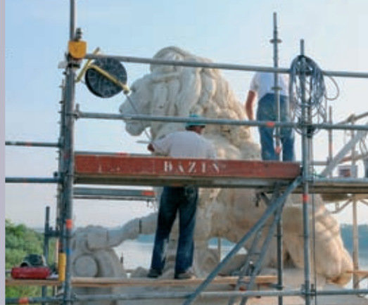
On a restauré les Lions, vestiges de l'ancien pont ferroviaire