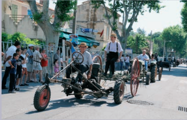
Défilé de machines agricoles pendant la fête votive à Raphèle fin juin