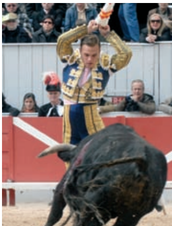
Feria du riz, Camargue gourmande, Fête du cheval P. 6