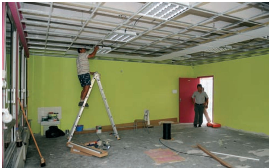
Gros travaux d'aménagement pendant l'été. Ici, dans l'école des Cantarelles