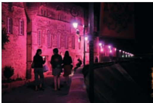
Le musée et la nuit fuchsia