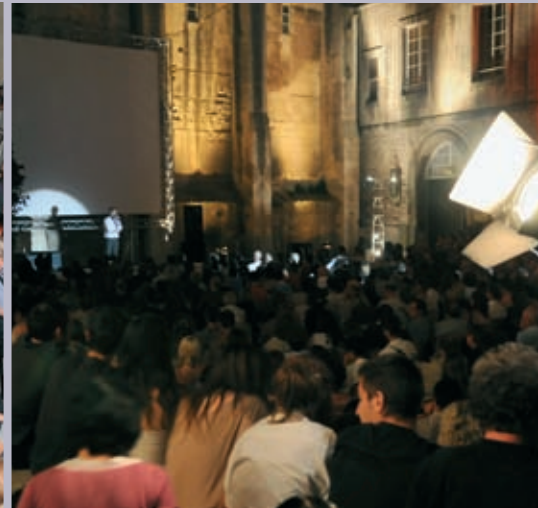
Dans la cour de l'Archevêché, projection de Voies Off