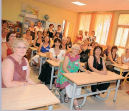
Les anciennes élèves fêtent les 50 ans de l'école Marie-Mauron