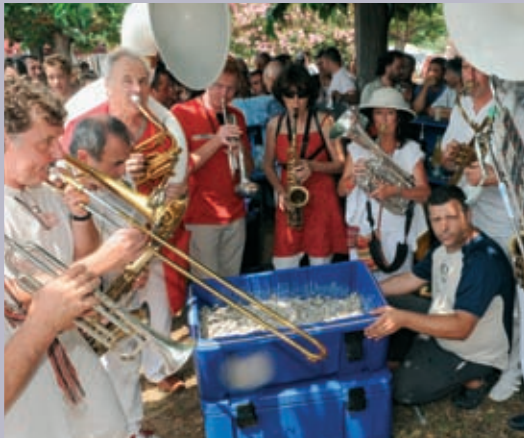
Concert en plein air et tellinade organisés par les Suds à Arles, à Salin-de-Giraud le 20 juillet