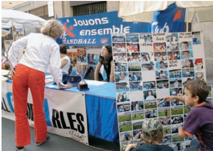
Les associations seront installées sur le bd des Lices, au jardin, sur l'esplanade Charles-de-Gaulle et dans la cour de l'Archevêché