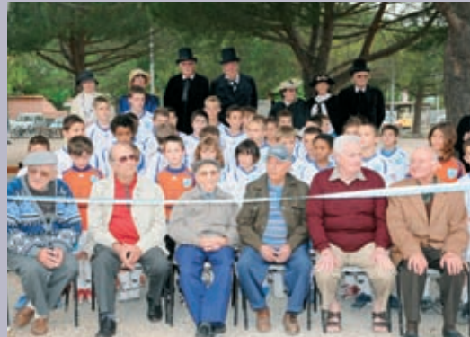
A Salin-de-Giraud, on a célébré en juin les 100 de l'ESSG