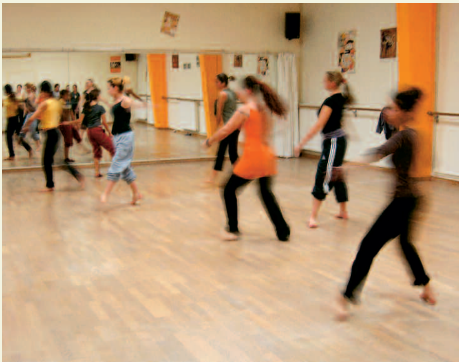
L'Atelier Saugrenu donne des cours et parallèlement prépare des créations chorégraphiques

qu'à développer sa pratique et c'est une belle réussite qu'il y ait sur Arles deux ateliers de danse, qui rendent cette pratique accessible. »