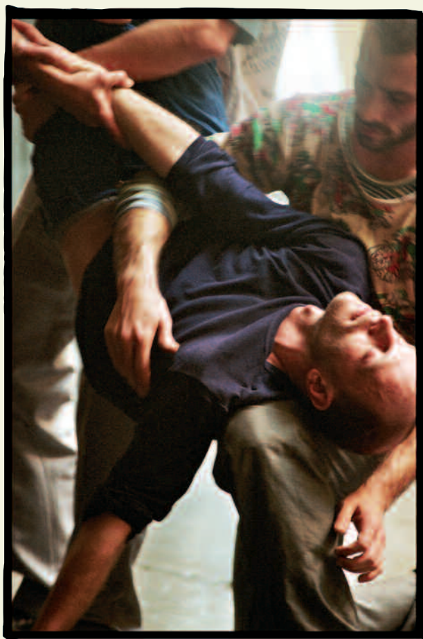
«Bâche», un des sept spectacles de danse proposés au théâtre d'Arles de février à avril

Dans Le Jardin* , autre « théâtre dansé » présenté la saison dernière par le même collectif belge, un homme riche racontait comment, vivant dans le luxe, il avait tout perdu. « Le Salon est un peu la suite du Jardin. Une famille raconte sa décrépitude, son déclin irréversible ».