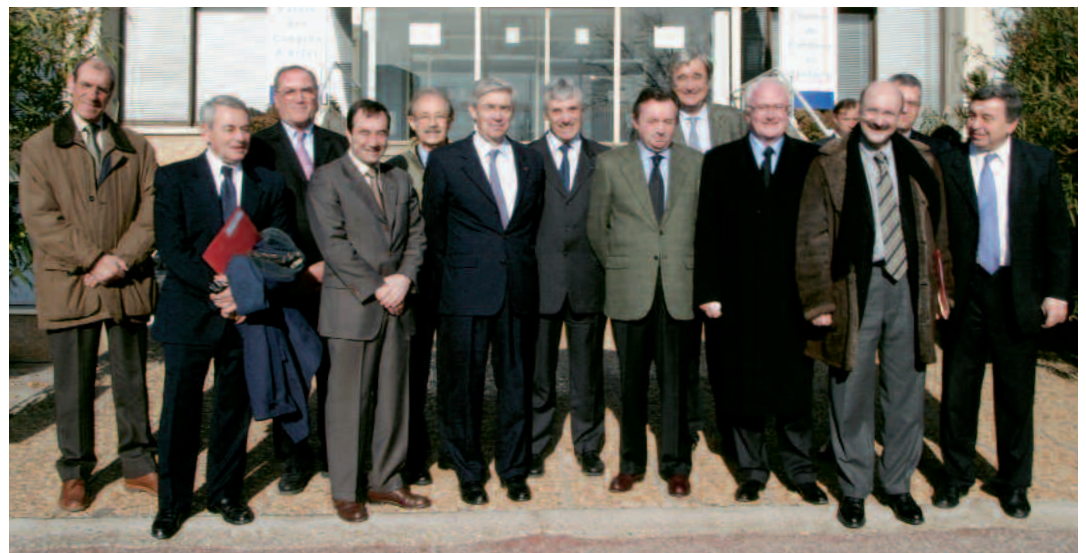
L'ensemble des élus régionaux ont salué la pertinence économique du nouvel équipement arlésien

C 'est fait. Arles dispose depuis le 20 janvier du plus grand chantier fluvial entre Lyon et la mer. Les paquebots hôtels de plus de 100 mètres, les porte-conteneurs et la plupart des bateaux fluvio-maritimes pourront désormais faire halte aux chantiers navals de Barriol pour réparation. L'équipement rénové et allongé, emblématique de ce que le fleuve peut apporter comme activité économique à Arles et aux entreprises du Pays