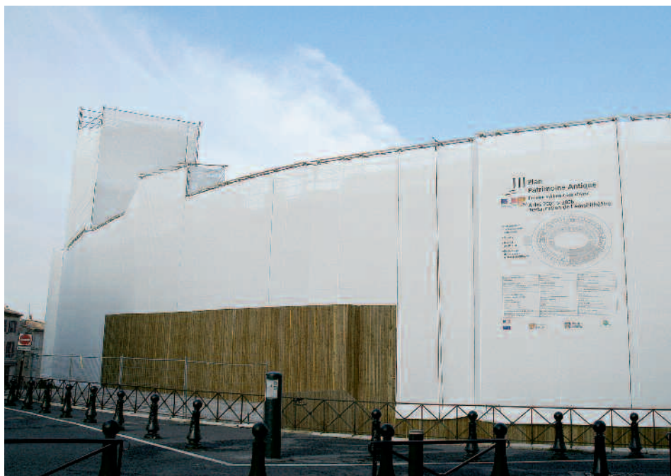
Le plan Patrimoine antique permet le financement de ces travaux sur plusieurs années

Les élus, les Arlésiens qui se sont rendus sur le premier chantier ont pu apprécier le sérieux et le souci esthétique