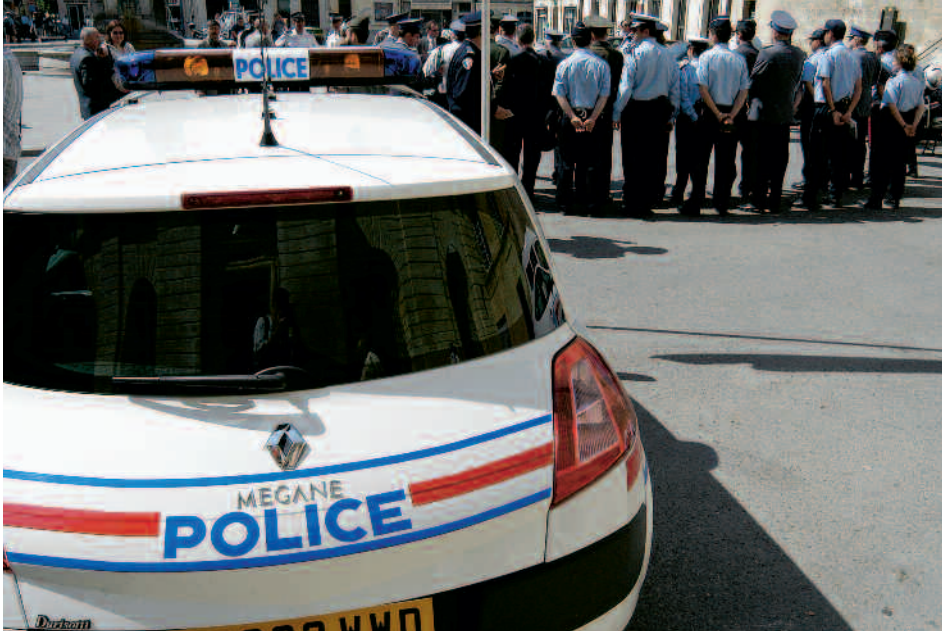
Police et services municipaux concourent à assurer la sécurité des manifestations et festivités

Moins de délinquance, moins d'accidents, plus d'affaires résolues. Depuis trois ans, les statistiques des services de police, de la gendarmerie, ainsi que celles du tribunal de Tarascon indiquent une baisse de la délinquance à Arles, une des villes du département où il y a le moins de délits.