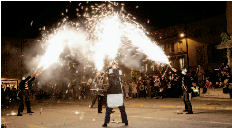
Jamais, sur Arles, on n'avait vu des animations de Noël aussi spectaculaires