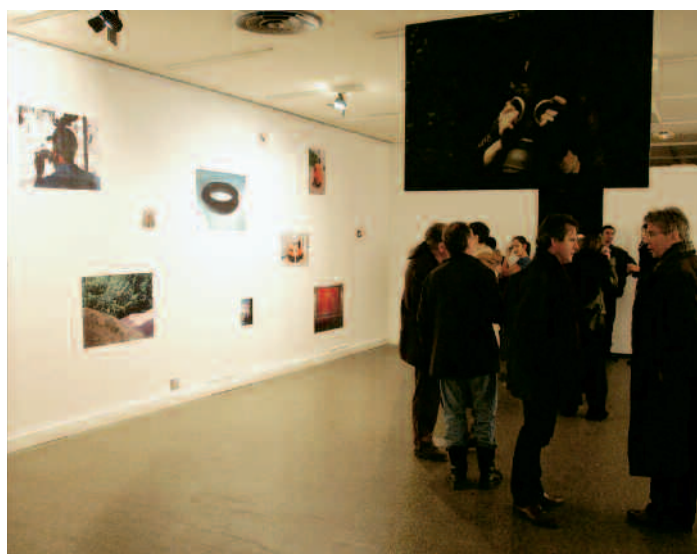
L'association étudiante l'Artscène aide à monter des projets communs

Le titre Ludotypes n'est pas neutre puisqu'il traduit le choix des étudiants d'interpeller le public par le dérisoire, l'ironie, le jeu du déballage. « Notre façon de regarder est aussi importante que ce que nous regardons » énonce un élève de l'ENSP. Une autre désacralise l'image et propose qu'on la touche, qu'on la manipule, au lieu de se