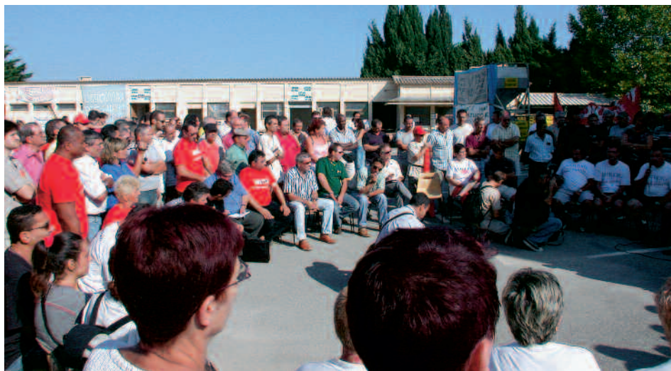
Dans la lutte menée depuis un an, les salariés ont le soutien des collectivités territoriales

Les salariés et leurs syndicats CGT et FO ont élaboré un projet de Scop (société coopérative ouvrière de production) qui pourrait reprendre l'activité rizicole abandonnée par Panzani. Les pouvoirs publics, notamment les collectivités locales, appuient ce projet et se sont engagées à participer au capital initial, préalable nécessaire à la remise en état du site et au premier pas de la future entreprise. Sollicité pour participer à la constitution de ce capital, Panzani a laissé porte close pour le moment. La lutte des Lustucru continue donc pour faire aboutir le projet industriel d'une