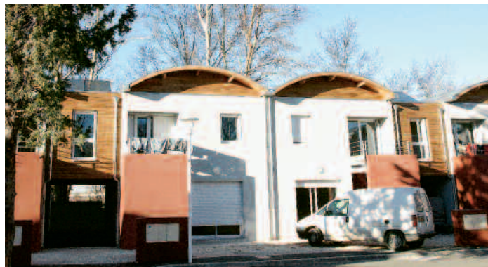
Quai des Platanes, un nouveau quartier de Barriol

Les 47 familles du camp de Barriol ont quitté définitivement leurs caravanes fin décembre et rejoint quelques mètres plus loin sur le canal d'Arles à Bouc les maisons neuves du quai des Platanes, construites par le promoteur de logements sociaux Vaucluse Logement.