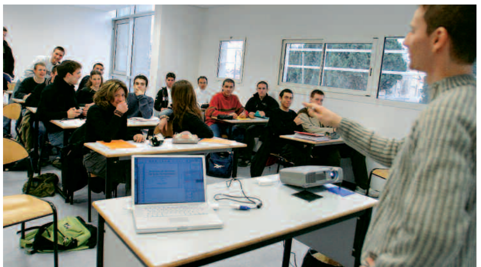
D'autres enseignements sont appelés à étoffer les formations de l'IUT