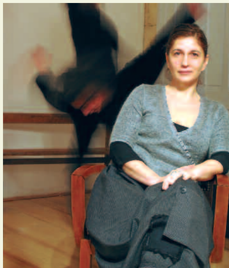
Lecture et mouvements au studio Incidence

Depuis trois ans, créations, spectacles et ateliers chorégraphiques se fédèrent et se mutualisent au travers des Premiers pas*. « Il y a ici un public amateur, adulte et adolescent, qui ne demande