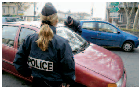
En 2005, les contrôles de police sur la route seront encore renforcés

Avec le soutien du procureur général du tribunal de Tarascon, un bureau d'aide aux victimes a été installé au rez-de-chaussée du commissariat en 2003. Les policiers invitent les plaignants à s'entretenir avec un juriste de l'Apers*, association d'aide aux victimes qui effectue par ailleurs un travail d'écoute similaire à la Maison du droit. « Ils sont présents tous les matins, six jours par semaine. Ces personnes font un travail formidable en relais du nôtre. Ils dédramatisent de nombreuses situations, ce que