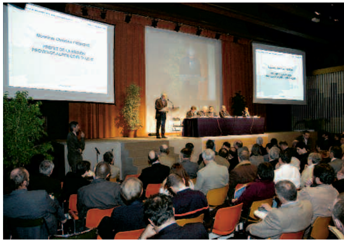
C'est à la Chambre de commerce et d'industrie que le préfet du Rhône, Jean-Pierre Lacroix, a présenté les premières études sur le fleuve et l'inondation de 2003

Comme les élus et les associations le demandent instantanément, le préfet Lacroix s'est engagé à partager les connaissances techniques rapportées par les experts. C'était l'objet du colloque du 5 décembre, au cours duquel des ingénieurs en hydrologie, en météorologie, les techniciens du ministère de l'Équipement, de l'urbanisme, les gestionnaires des ouvrages existants, comme ceux de la Compagnie nationale du Rhône (CNR) et les historiens ont présenté leurs contributions au rapport