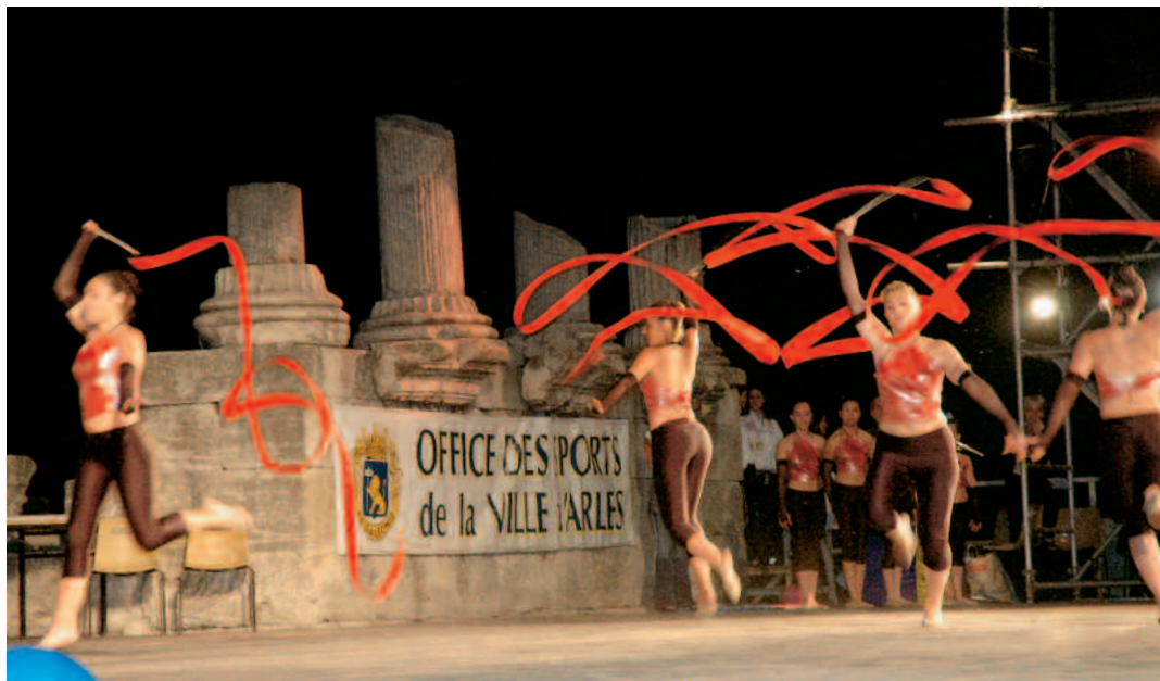
En juin, la remise des récompenses aux sportifs, organisée par l'Office des sports au Théâtre antique, est un grand moment de la vie arlésienne qui mêle le sport et l'art

Arles compte plus de 8 000 licenciés au sein des différentes associations sportives. À bien des égards ce chiffre est un bon indicateur pour la ville.