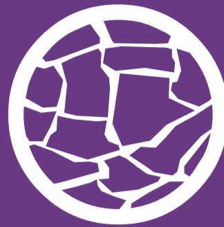
Mouvements de terrains liés à la sécheresse